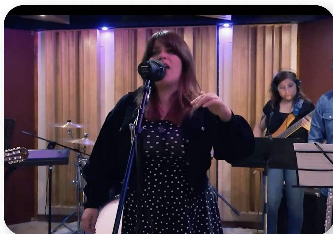
Antu - Vidas Pasadas

Producción musical integral y postproducción profesional: grabación, composición, arreglos, mezcla y masterización de música clásica, folclórica y popular, además de servicios completos de edición y postproducción sonora en entornos acústicamente calibrados.