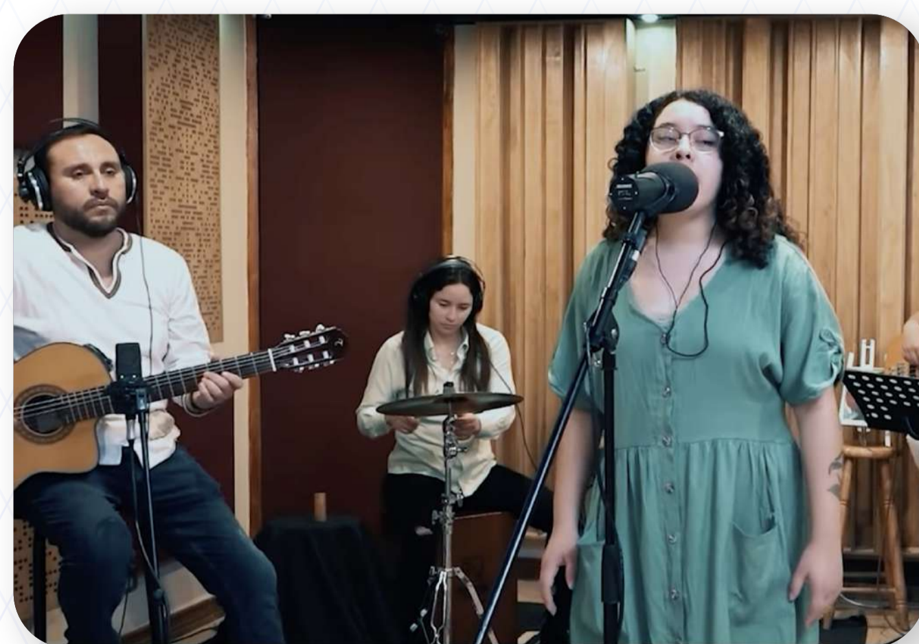
Atacamecha - Aire