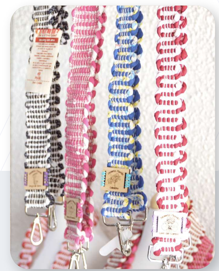
Strap con gancho

Gestión de suprarreciclaje textil artesanal: recuperación y transformación de residuos textiles postconsumo e industriales del Desierto de Atacama mediante técnicas ancestrales de tejido, articulando economía circular, rescate patrimonial y producción con impacto social.