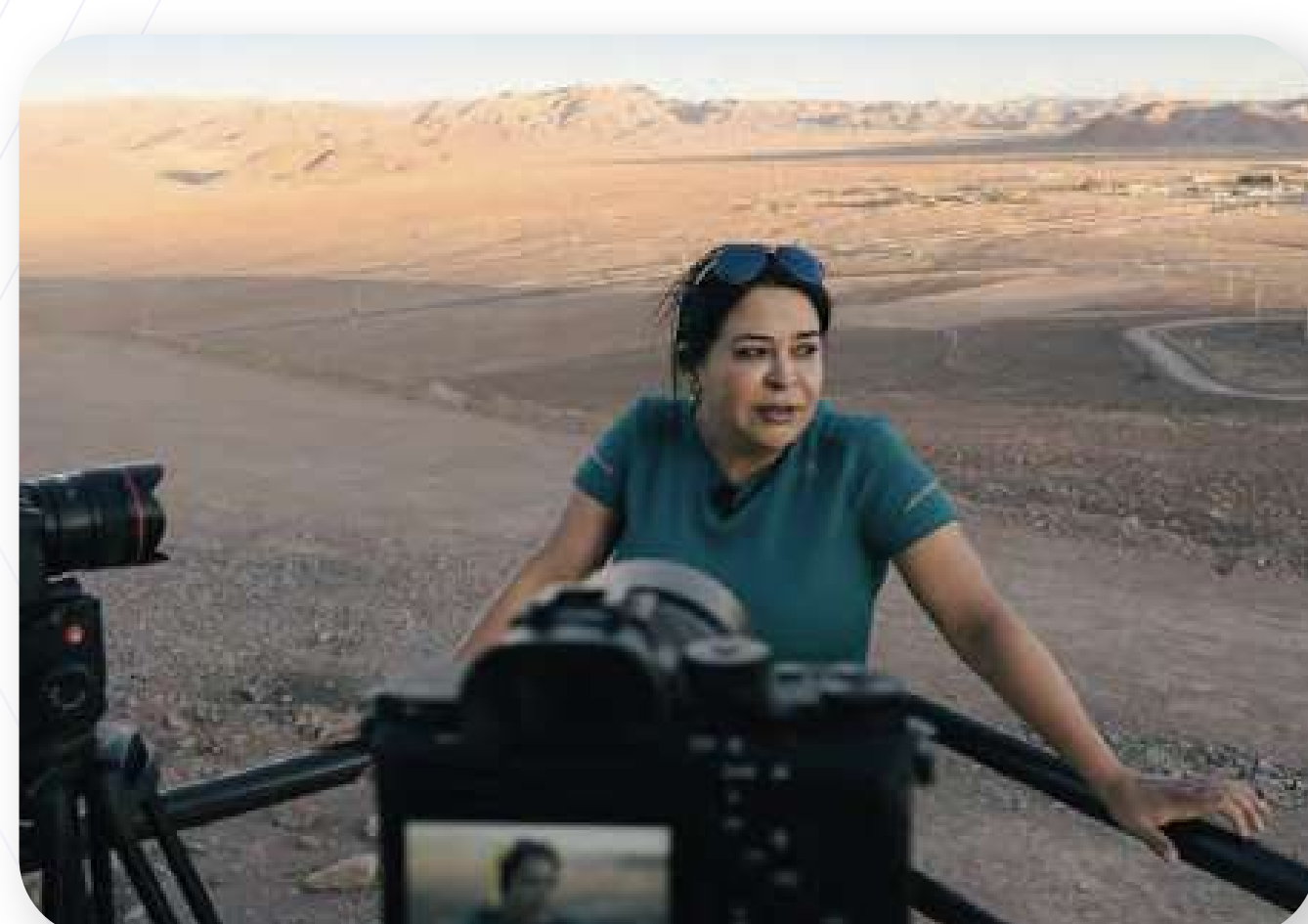
Arriba en las estrellas

Producción audiovisual: documentales, series, videoclips y contenidos culturales y corporativos.