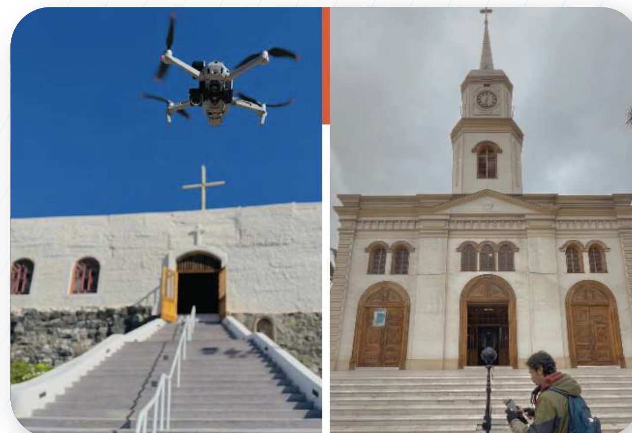
Legado Virtual de Atacama

Realidad virtual y experiencias inmersivas: desarrollo de proyectos en VR 360°, realidad aumentada y realidad mixta. Además, sistemas inmersivos de capacitación, evaluación y seguridad industrial.