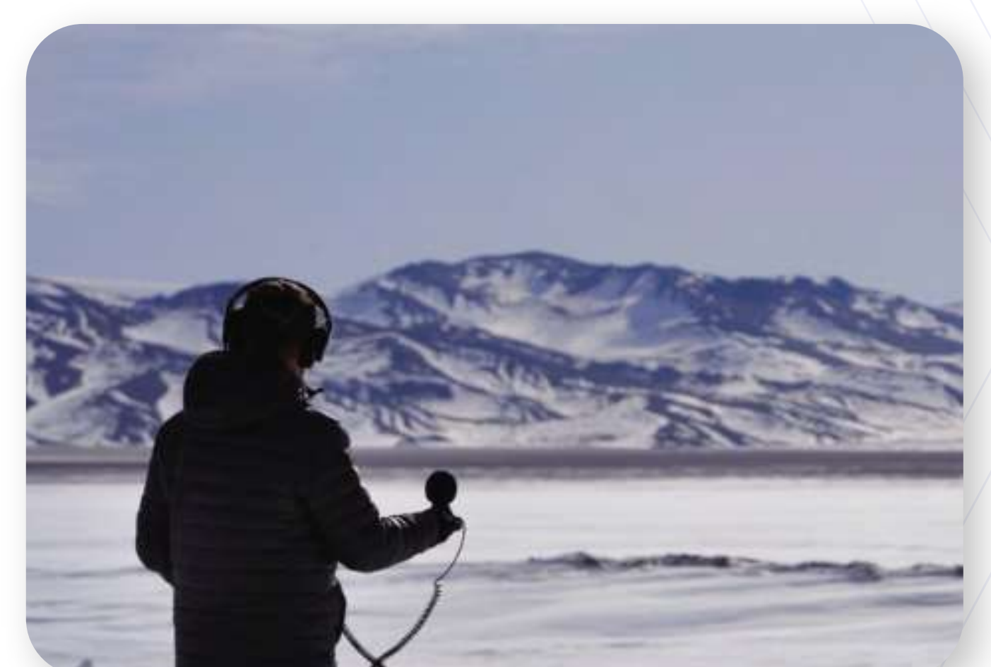
La música del silencio

Contenidos corporativos y comunicaciones: producción audiovisual estratégica para empresas e instituciones.