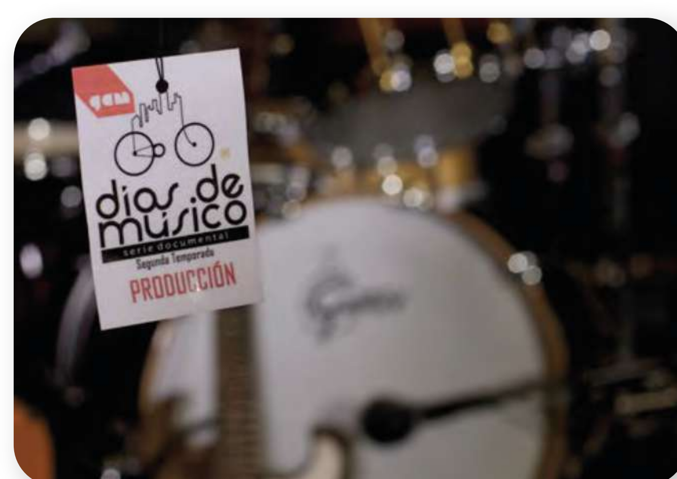
Días de Música